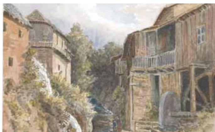
Haut - À Grésy-sur-Aix, le Sierroz rejoint la Deisse dans une belle cascade. Milieu et bas - Moulins et belvédère de la Cascade.

Touriste illustre de la ville d'Aix-les-Bains, la reine Hortense est une grande figure féminine de l'Empire. Son amie d'enfance, la baronne Adèle de Broc se noya sous ses yeux aux Gorges du Sierroz le 10 juin 1813. L'accident eut un écho dans toute la France et donna sa dimension tragique et romantique au site. Ces gorges pittoresques et la stèle que fit élever la Reine Hortense en mémoire de son amie ont attiré une foule de visiteurs à l'image de Napoléon III qui vint s'y recueillir en 1860.